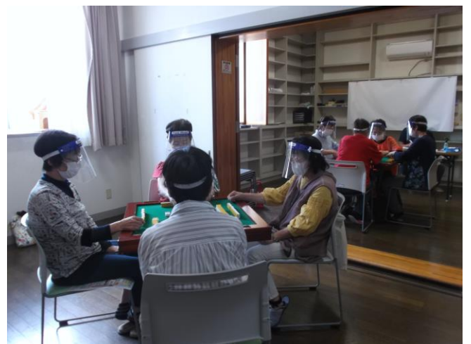
<健康マージャン事業の様子>