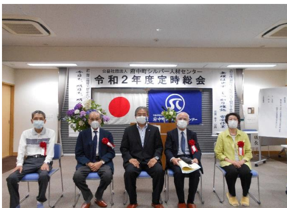
＜会員表彰者と記念撮影＞