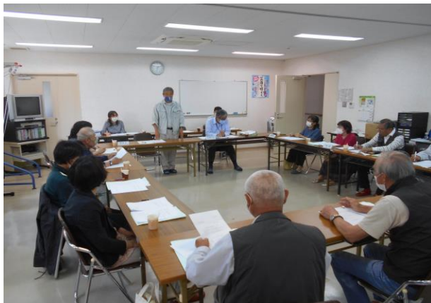
<令和2年度第1回理事会の様子>