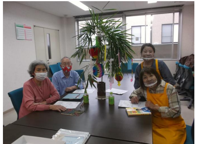
<オレンジサロン事業の様子>

コロナウイルス感染症拡大防止対策のため休止していた事業を再開しました。新しい生活様式を取り入れ、会員・利用者ともにいきいきしている様子でした。