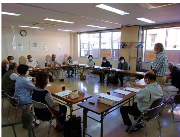
<令和3年度第3回理事会の様子>

役員賠償責任保険の加入について 令和3年10月1日からの最低賃金 の改定について