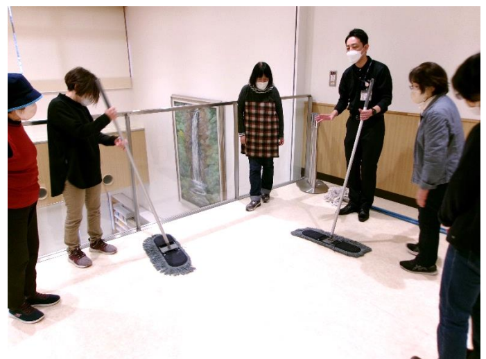
<屋内清掃就業会員講習会の様子>

3月23、24日に府中公民館で開催し、25名の会員さんが参加しました。清掃道具の使い方、清掃方法について学びました。