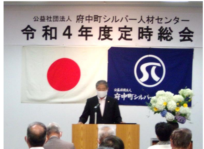
<令和4年度定時総会の様子>

6月に定時総会を開催予定としております。開催通知については、6月上旬に発送予定です。また、新型コロナウイルス感染症の状況により規模を縮小することがあります。詳しくは開催通知で案内しますのでご確認をお願いします。